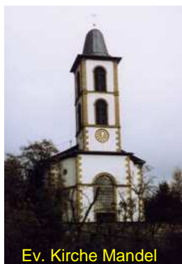
Ev. Kirche Mandel